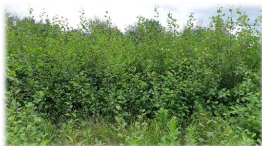
Plantation d'épinettes blanches envahie à Bury