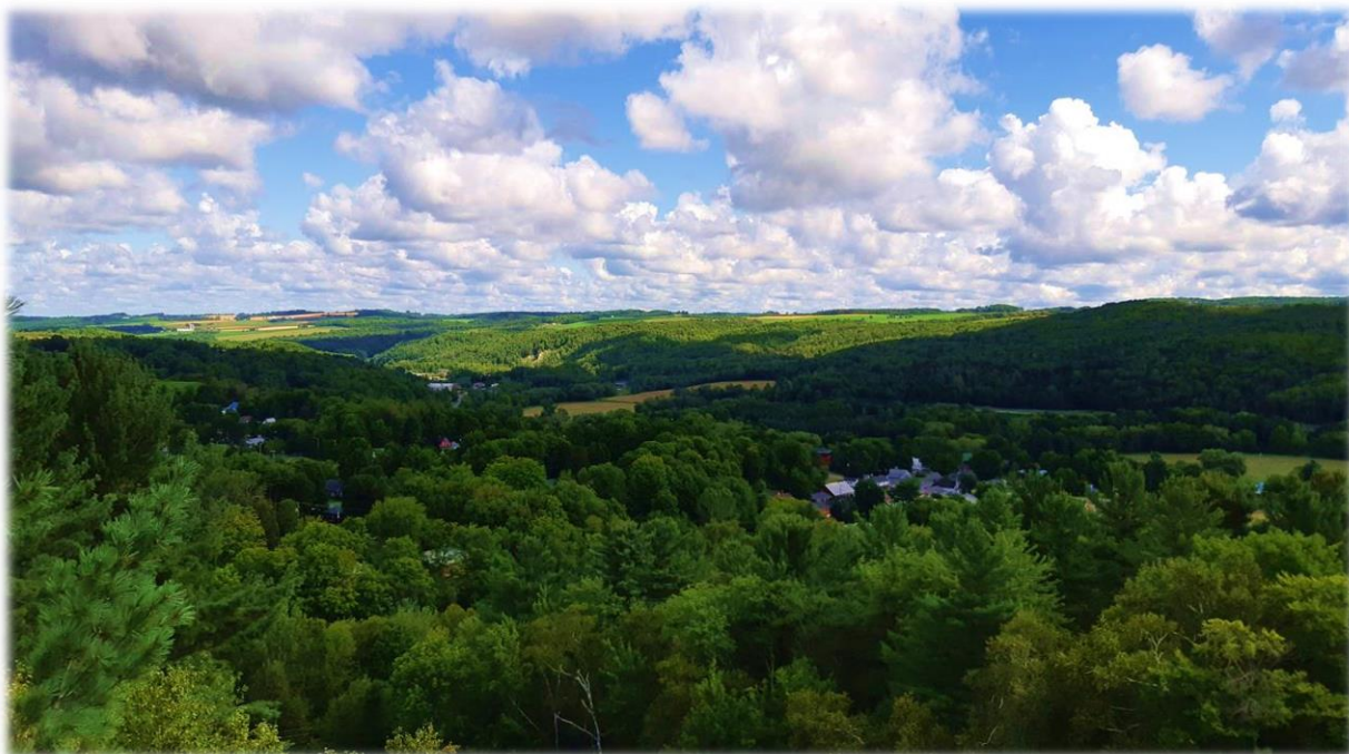
Panorama observé du Parc de la Gorge de Coaticook