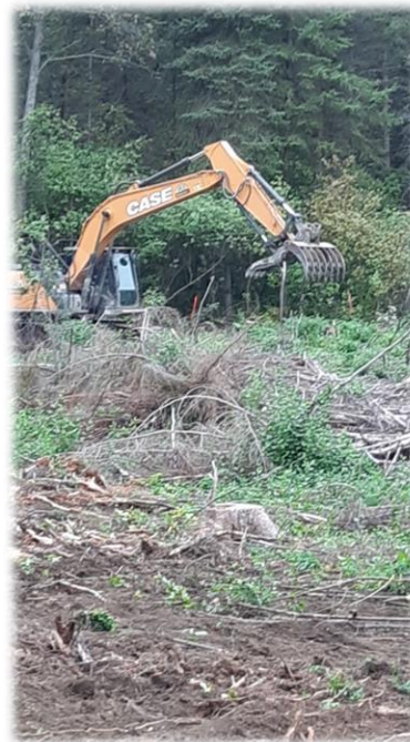
Préparation de terrain avec une pelle-peigne