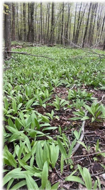
Population d'ail des bois en érablière