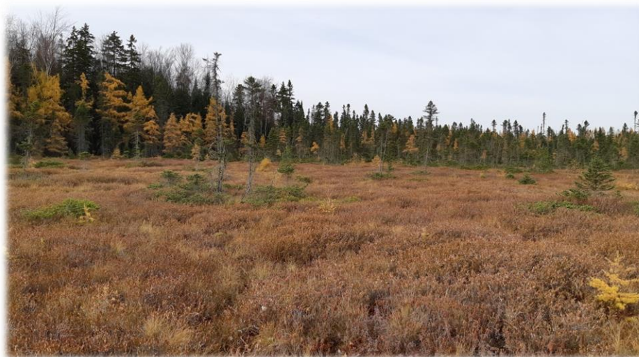
Tourbière au Parc écoforestier de Johnville