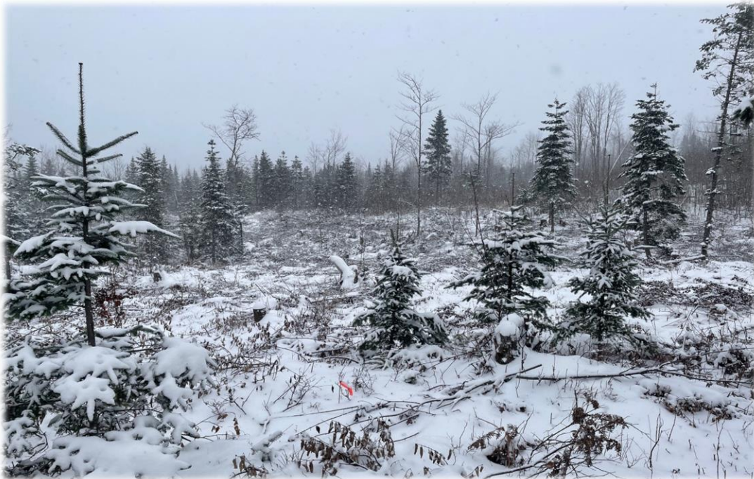
Éclaircie précommerciale mixte

Aucune somme n'a été perçue par l'Agence en 2022-2023 pour cause de destruction de l'investissement.