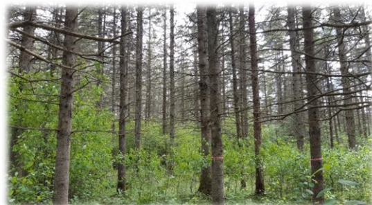
Nerprun bourdaine au Parc écoforestier de Johnville