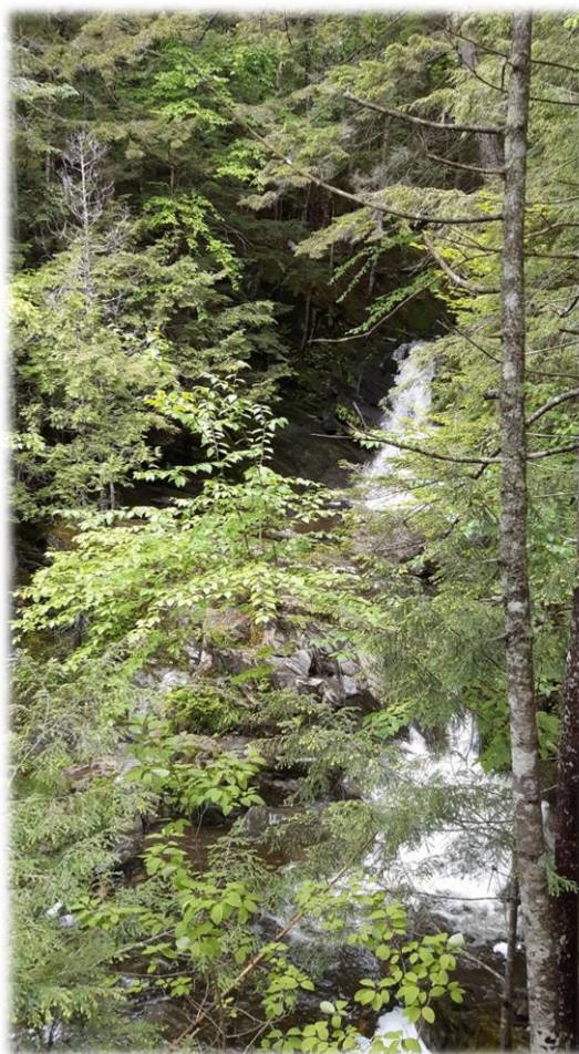
Chute à Donat, Forêt Hereford

...et les autres Agences régionales des forêts privées du Québec.