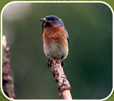
Merlebleu de l'Est J. Lehoux

Le merlebleu de l'est est un petit oiseau magnifique. Son plumage bleu et sa poitrine rousse en font un visiteur très prisé des amateurs d'oiseaux. Les populations de merlebleu ont subi un déclin important au milieu du siècle en partie à cause de la perte d'habitat et de la compétition avec le moineau domestique et l'étourneau sansonnet. Depuis plus d'une vingtaine d'années, les ornithologues ont réussi, grâce à la construction et l'installation de nombreux niochirs, à faire augmenter les populations de merlebleu de l'est. Voici un plan pour la réalisation d'un nichoir à merlebleu que vous pourrez installer sur votre propriété.