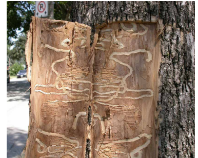
▲ Galeries creusées par les larves.